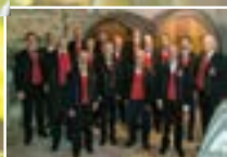
la chorale des vignerons de Goxwiller