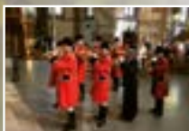
Les échos du Guirbaden (trompes de chasse)