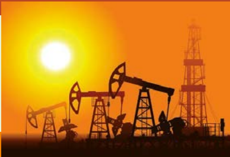
oil pumps and rig over sunset vector id491761150

L'Union européenne, dans son 18e paquet de sanctions, a remplacé le plafond fixe de 60 dollars par baril (environ 50 euros) par un mécanisme plus flexible limitant le prix du pétrole russe à 15% en dessous des prix mondiaux. Cette mesure réduit significativement les revenus tirés de chaque baril vendu à l'exportation, accentuant la pression sur Moscou. Mais ce n'est pas tout: les tensions commerciales s'intensifient également loin des eaux européennes, avec des menaces tarifaires venant des États-Unis.