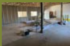
TRAVAUX RÉALISÉS À WISCHES

31, route de la Wantzenau 67800 HOENHEIM 06 32 02 84 61 www.alsacetravaux-67.com